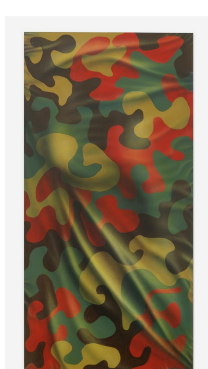
Herbert Warmuth Camouflage (obj.), 2001 Lack, Acryl auf Aluminium 200 x 100 cm