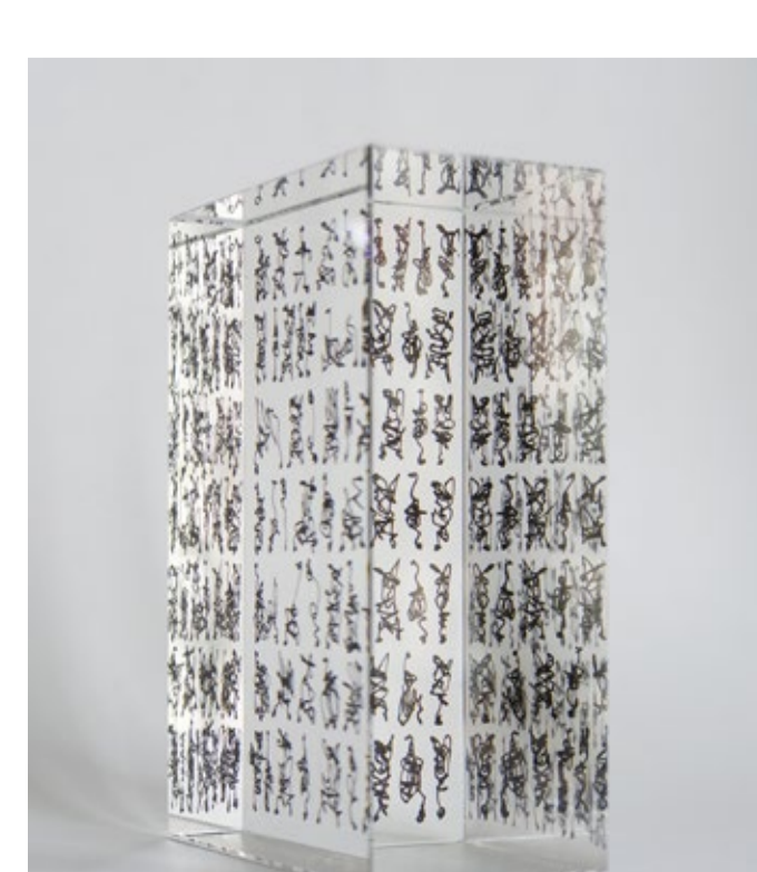
Axel Malik deconv, 2019 Acryl auf Glas 6 x 10 x 15 cm / 2200g

Titelbild: Samuel van Hoogstraten (1627–1628) Briefablage mit Schreibgeräten/ Feigned Letter Rack with Writing Implements, Circa 1655 Öl auf Leinwand 67,9 x 80,3 cm Geschenk von Jo Wallace Walker zu Ehren von Burnett Walker San Diego Museum of Art Wiki Data Q436797