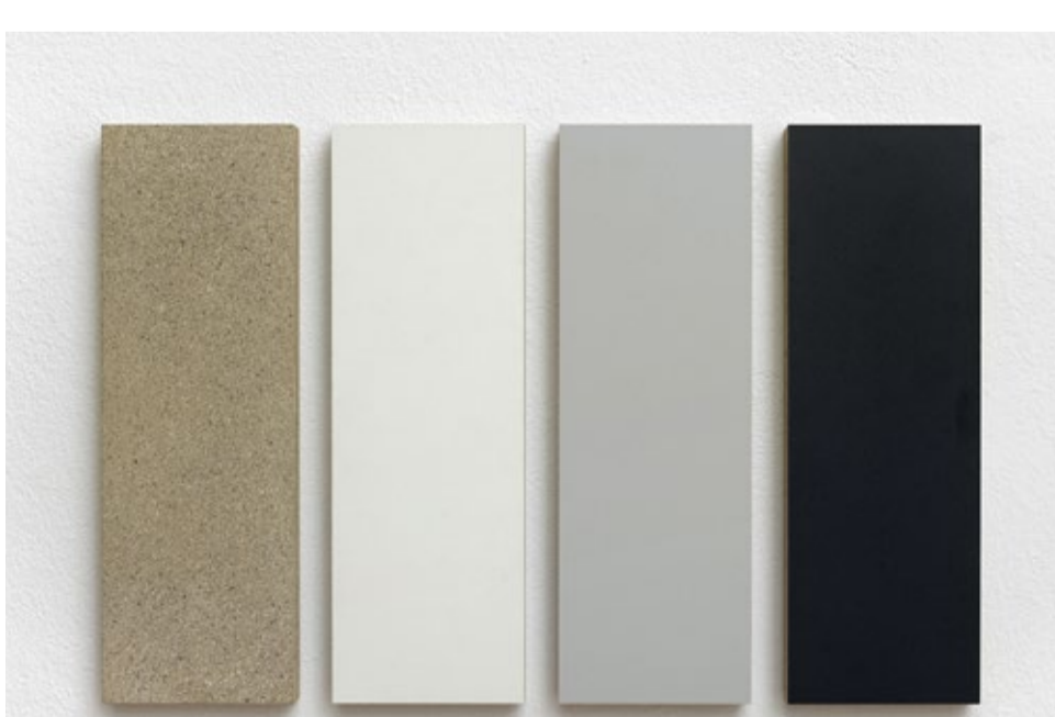
Joachim Grommek Test, 2002 Öl, Grundierung auf Spangplatte und kunststoffbeschichteter Spanplatte (weiß, grau, schwarz) 4-teilig, 30 x 46 cm